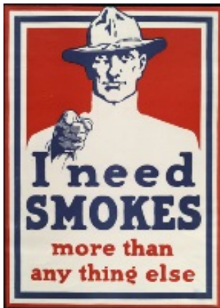
Poster tijdens Eerste Wereldoorlog

De Volksstem, 21 november 1917: “Eersel. – Door de fa. Wed. Aarts & Zn. alhier, is aan haar werkvolk andermaal 10 per cent verhooging toegekend, z.g.n. duurtetoeslag. In deze dure tijdsomstandigheden voorzeker niet van de hand te wijzen.”