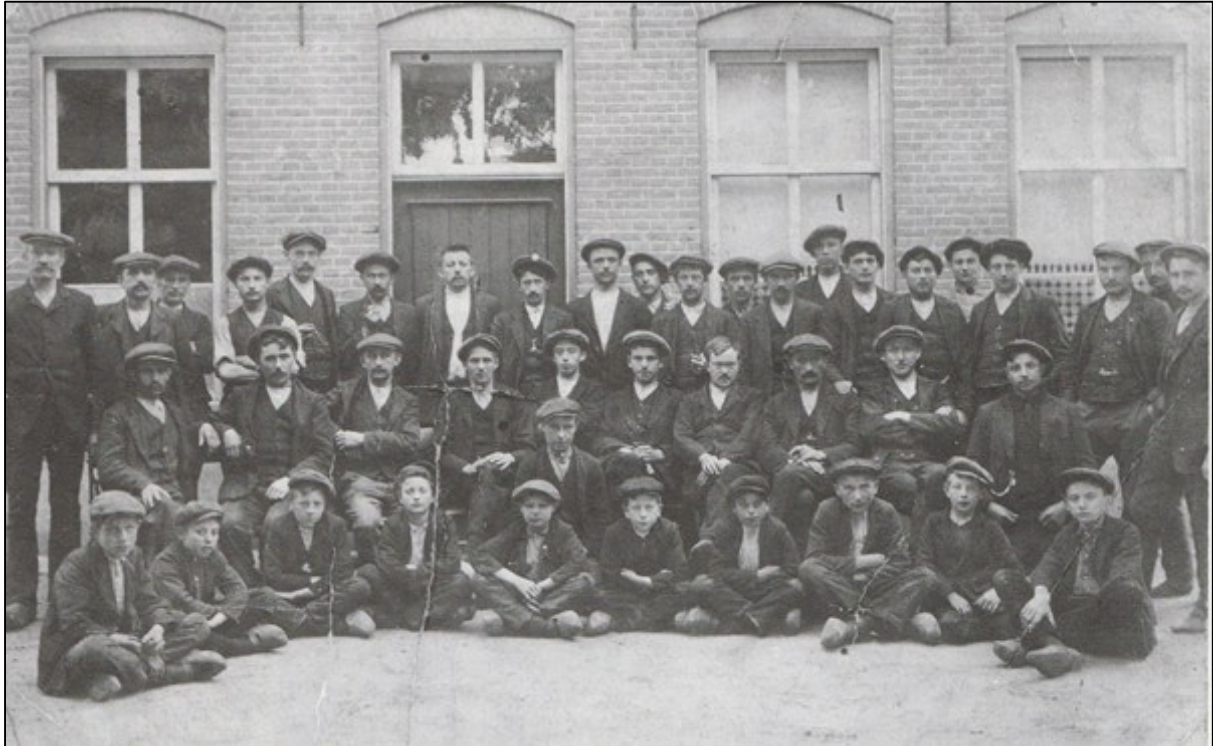
Het personeel en de sigarenfabriek van de Wed. Aarts & Zonen in 1910.