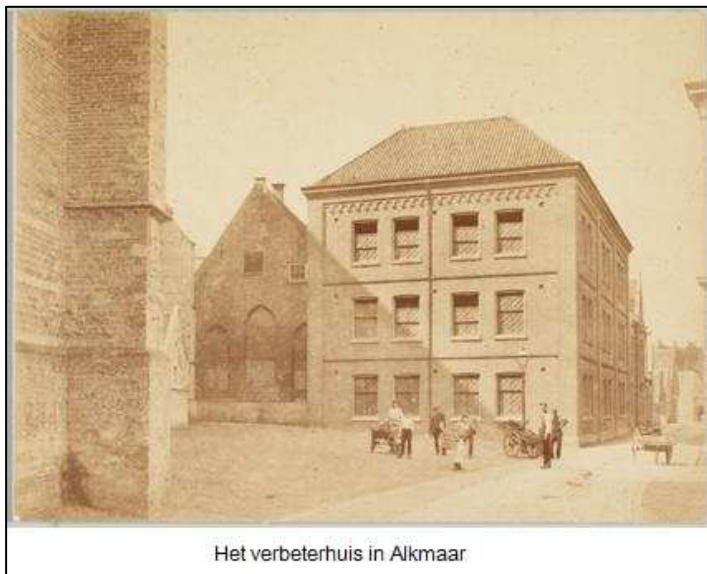
Het verbeterhuis in Alkmaar

Daags erna was de burgemeester al op de hoogte van het vonnis. Hij verkreeg die informatie van de voerman die de jongen op een kar naar Den Bosch had vervoerd, op kosten van de gemeente. Op 8 april schreef hij een brief naar de Procureur Generaal bij het Provinciaal Gerechtshof met het verzoek “mij te willen berigten of den jongeling weselijk tot overbrenging naar een verbeterhuis is veroordeeld en op welke wijze hij moet worden overgebracht daar hij de reis niet te voet kan afleggen, en ik veronderstel dat de overbrenging van deze reis ten laste van het rijk zal komen.”